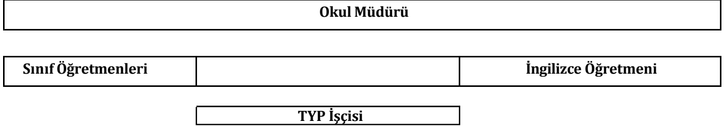
Şekil 1. Tavas Kızılcaölük Mehmet Akif Ersoy İlkokulu Teşkilat Şeması